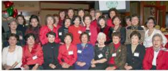
<연말 파티와 총회를 한 워싱턴 디씨 지회>