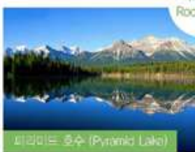
피라미드 호수 (Pyramid Lake)