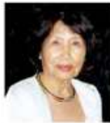
토론토지회 유 인 회 교문