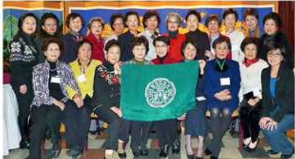
< 2011 연말파티 >

워싱턴디씨 지회(동창회)는 1957년에 발족해서 최정림 동문을 초대 회장으로 추대하였고 이화여대 소개 총동창회 북미주 지회연합회에 속하고 약 350명의 회원으로 구성된다.