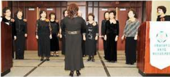
< 2011 보스턴 총회에 참가한 합성단 >

금년 연말 모임은 부부동반 모임의 해라서 임원들은 호텔 예약, 사회자 등 크고 작은 일로 바쁜 마음으로 살아가고 있습니다. 11월 밴쿠버에서 만나 뵙기를 바라며..