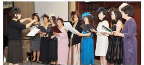
< 2011 보스턴 지회 총회의 합창 모습 >

2012년 11월 1-4일 밴쿠버에서 다시 만나기로 약속하면서 아쉬운 작별을 했다.