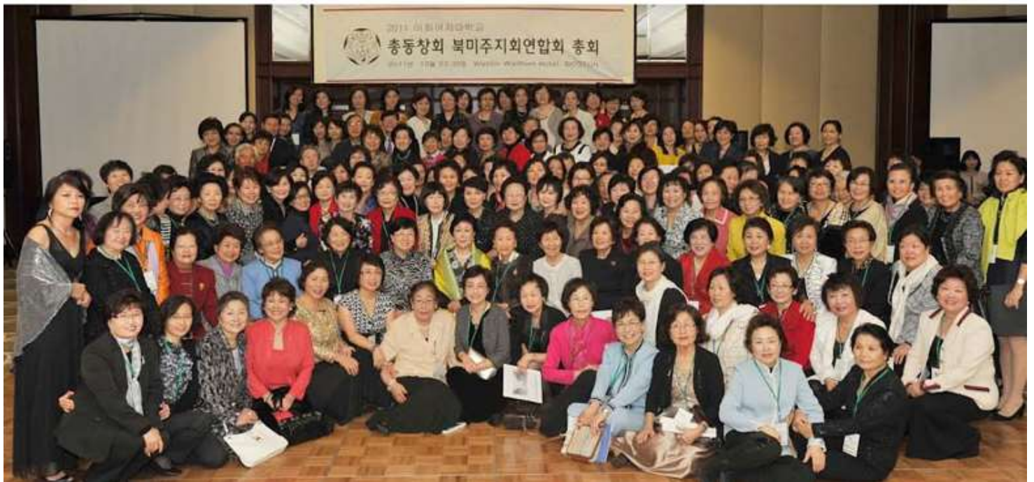
< 2011년 이화여자대학교 총동창회 북미주 지회연합회 총회 (보스턴) >