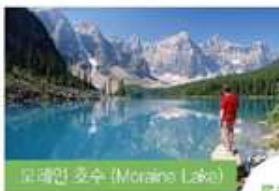
모레인 호수 (Moraine Lake)