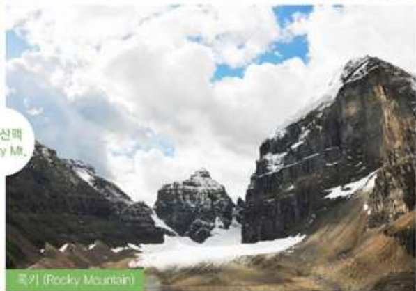
록기 (Rocky Mountain)