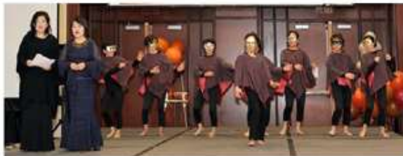
< 2011 보스톤 총회 발렌트쇼 대상을 받은 북가주 지회 >

북가주 지회는 지난 보스톤에서의 북미주 지회연합회에 다수가 참석하여 뉴햄프셔와 메인주의 여행을 했으며, 재미있는 프로그램과 총장님, 총동창회장님과의 만남을 가졌고 토요일 탈렌트쇼에서 대상을 받았다.