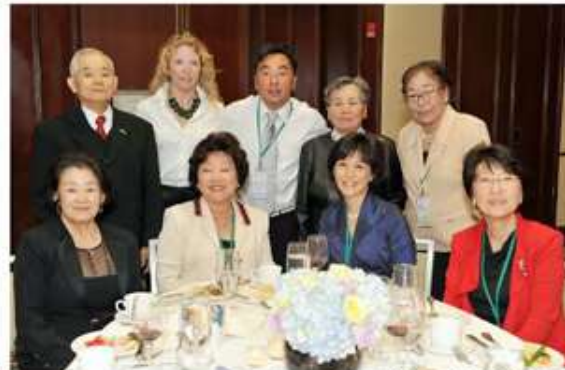
< 아들 내외와 함께 참석한 지회연합총회에서 >

이런 저런 생각을 하며 넓고 넓은 공원을 걷다보니 어느새 태양이 붉게 용솨음치며 떠오른다. 참 상쾌한 아침이다. 이제 그동안 사다가 쌓아만 놓고 한 번도 쓰지도 입지도 않았던 것들을 꺼내려다. 그리고 맛있는 요리를 해서 식구들에게 주고 싶다. 이제 남은 여생을 금혼기라던가, 마음 편하게 아침 일찍 남편과 함께 운동으로 시작해서 건강하고 적극적인 생활을 하려다.