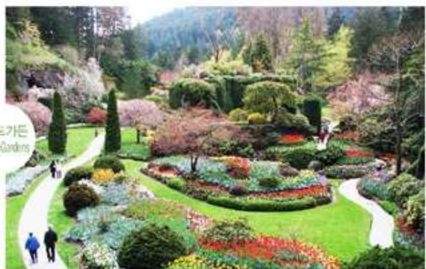
부처드가든 Bulchert Gardens