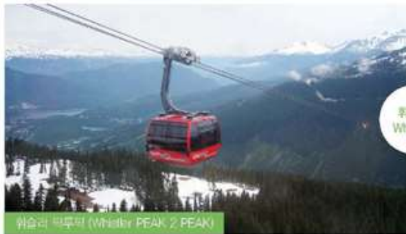
휘슬러 피크투피크 (Whistler PEAK 2 PEAK)