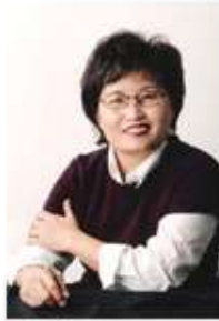
캐나다 뮤즈 한국 청소년 교향악단 상임지휘자, Violinist, 수필가