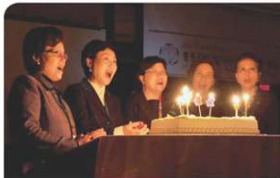
< 이화 125주년을 축하하는 케이크 앞에서 >

자리를 지키면서 큰 힘을 발휘하시는 동창 여러분께 하나님의 평강과 축복이 함께 하시길 기원합니다.