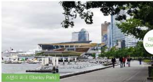
스탠리 파크 (Stanley Park)