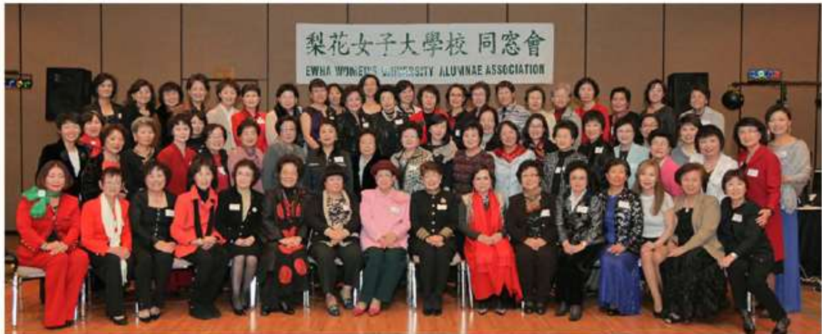
< 연말 정기총회 >