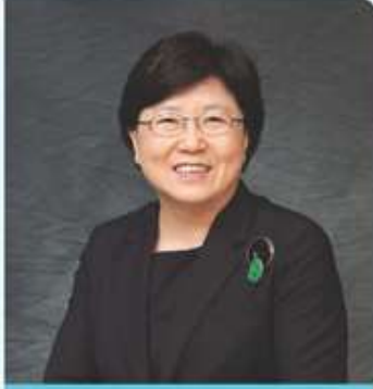
이화여자대학교 총장 김 선 옥