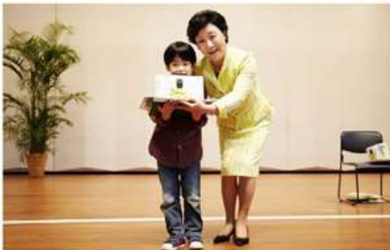
5월 12일(토) 10시 부모와 할머니의 손을 잡고 대강당 앞

총동창회가 1년 중 가장 푸르고 아름다운 5월에 개최한 <이화가족 어린이 그림그리기 대회>는 이화동창 가족들에게 어머니와 할머니, 그리고 아내의 모교를 방문하여 즐거운 하루를 보내게 만든 뜻깊고도 귀중한 행사였다.