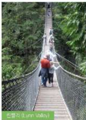
린밸리 (Lynn Valley)