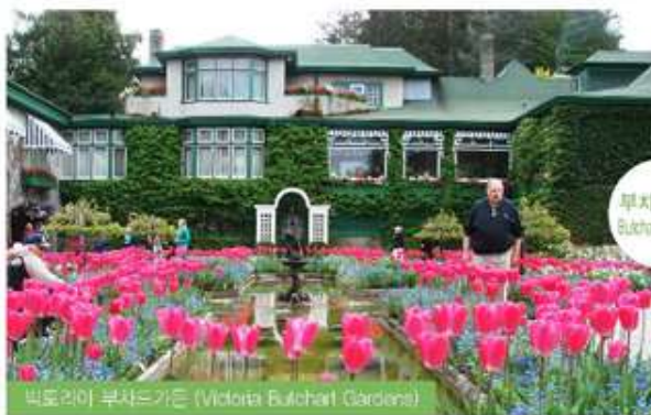
빅토리아 부처드가든 (Victoria Bulchert Gardens)