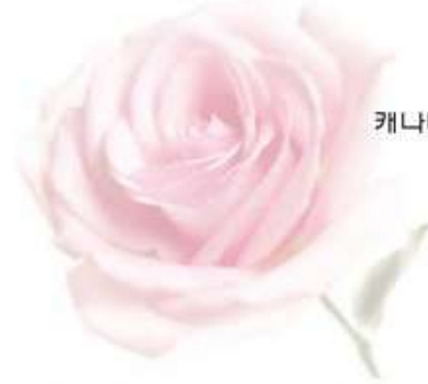
신영봉 교육 69 캐나다 토론토 거주

우리는 정말 칭찬에 인색하게 생활해 왔다. 칭찬하는 것이나 듣는 것에 대해 속스럽다고만 생각해 왔다.