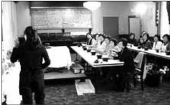
지회장: 박영진(85 과학교육)